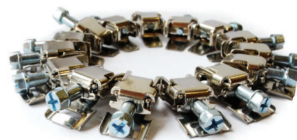
Стопорний пристрій СУ 50 для ХБР 3000