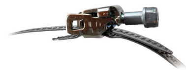
Зручний механізм замка в хомутах ХБ та ХБР