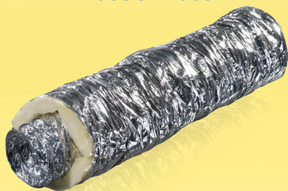
605-Ізо М0 605-Ізо М1

Гнучкі теплоізольовані повітропроводи з алюмінієвої фольги