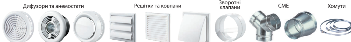
Дифузори та анемостати