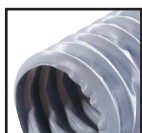
Сірий ( )