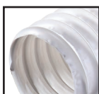
Білий ( )