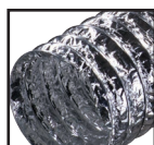
Алюмінієвий ( )