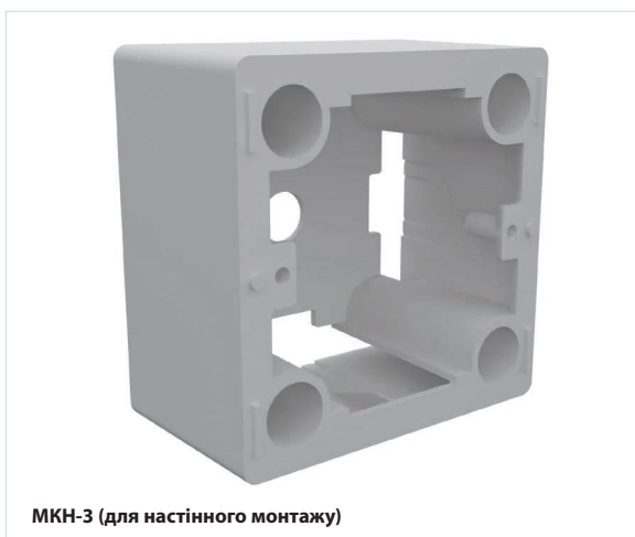
МКН-3 (для настінного монтажу)