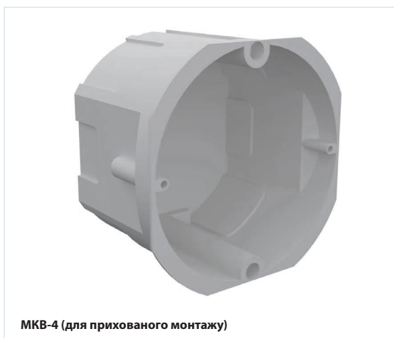
МКВ-4 (для прихованого монтажу)