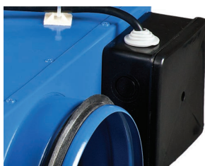
Зовнішня клемна коробка для подавання живлення

Електричне підключення та встановлення повинні виконуватися згідно з інструкцією та електричною схемою, зазначеною на клемній коробці.