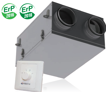
Перемикач швидкостей А3

Припливно-витяжна установка з рекуперацією тепла у компактному звуко- і теплоізолюваному корпусі. Продуктивність – до 100 м³/год. Ефективність рекуперації – від 64 до 76 %