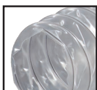
Прозорий ( )